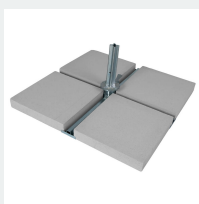
Podstawa PDUE-B50 RIO