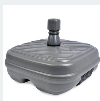
Podstawa plastikowa 45l (dla 1.8m KWADRAT)