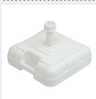
Podstawa BKR (Nie dla 1,8m KWADRAT)