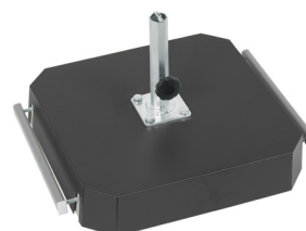
stalowa nakładka na podstawę jako dodatkowa opcja

Więcej podstaw na naszej stronie www.litex.pl