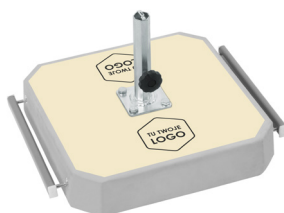
laminowana naklejka z dowolnym nadrukiem jako dodatkowa opcja